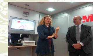
La directora de Trabajo con el Alcalde de Lozoyuela.

municipio como para difundir la cultura preventiva entre las